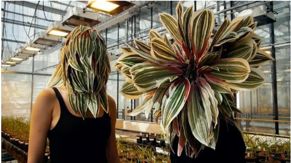
Karine Bonneval, Devenir-plante , 2017, Filmstill, © Karine Bonneval

Residenz – Workshop – Ausstellung – Konferenz – Ideen- und Forschungswerkstatt – Performance – Lesegruppe