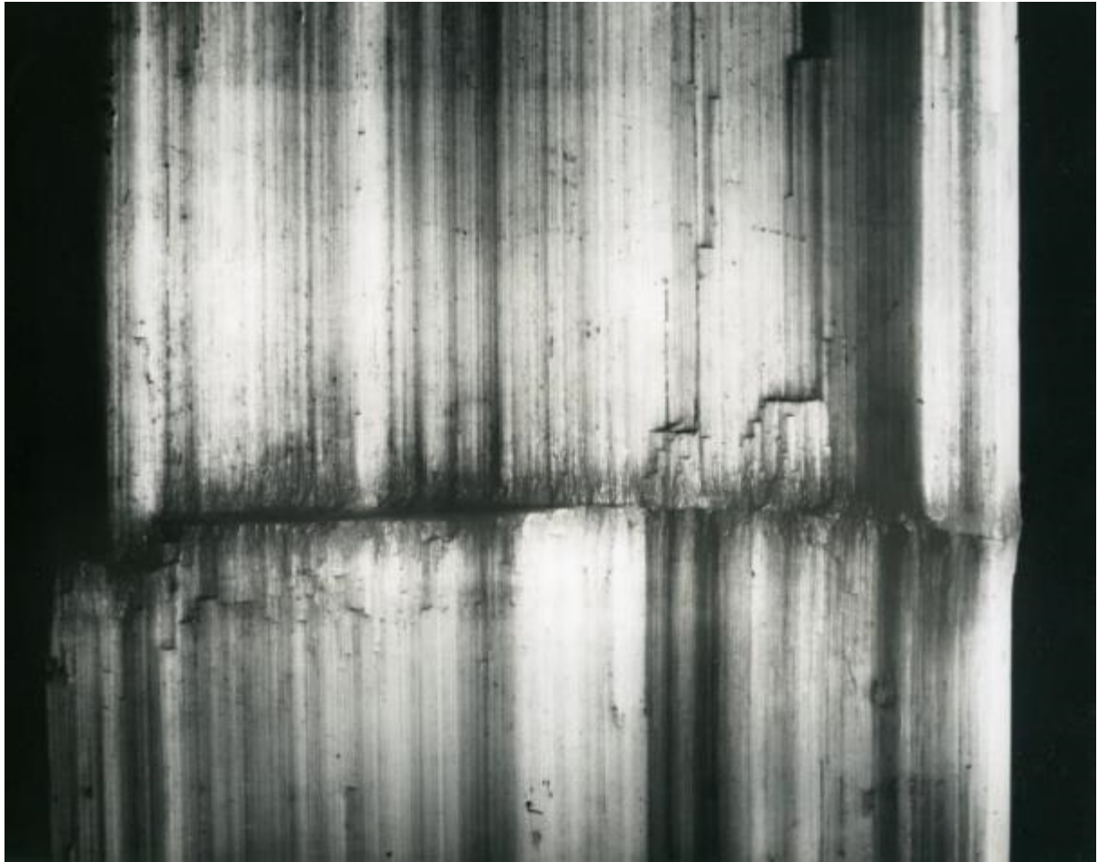
Alfred Ehrhardt, Wachstumskante am faserigen Gips, Bristol, England, 1938/39