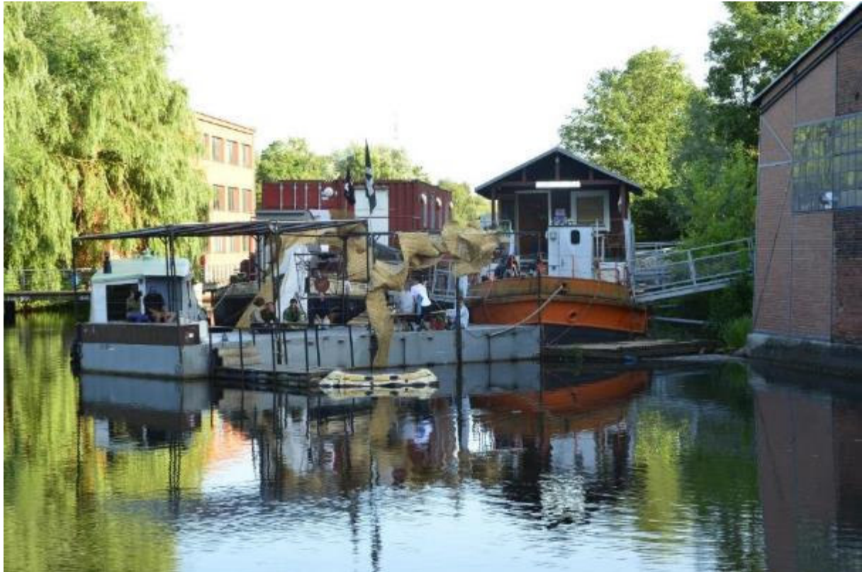
Das Archipel im Veringkanal, Sculpture navale #1 2018 © Das Archipel

Workshop – Ausstellung – Ideen- und Forschungswerkstatt