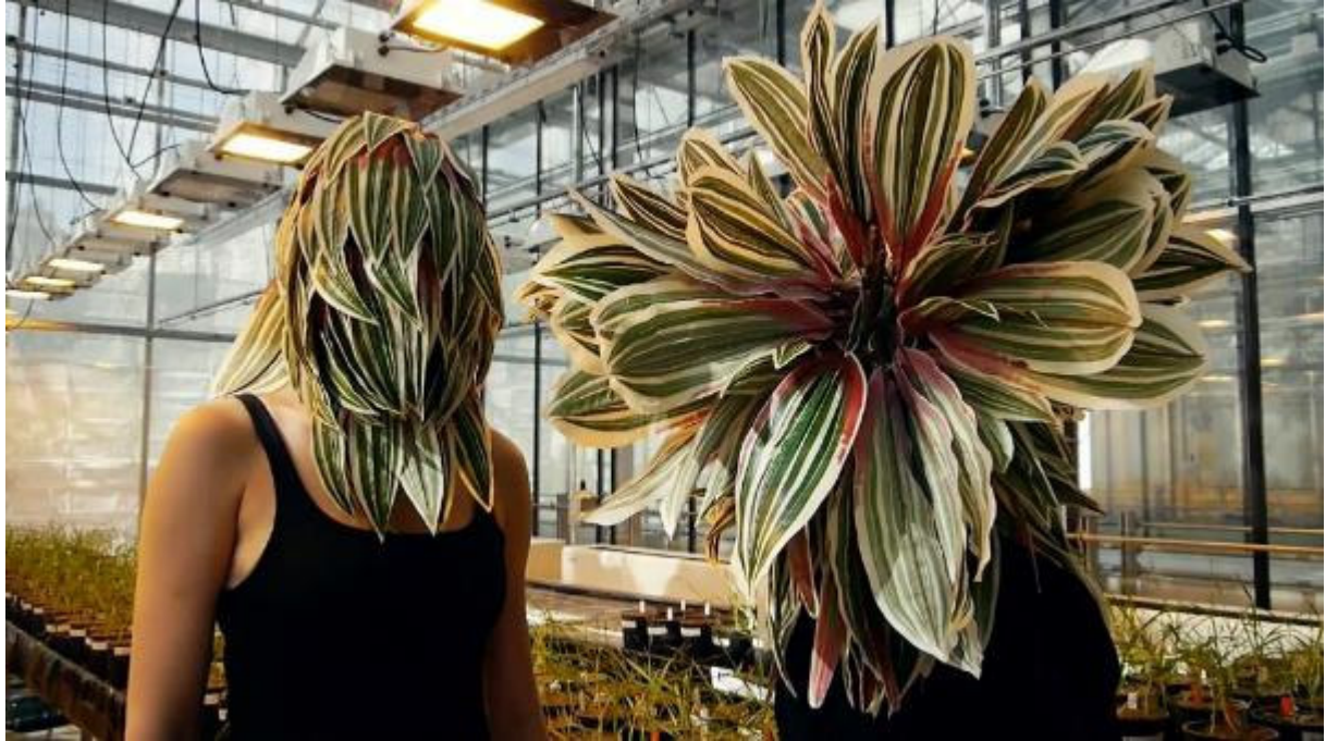
Karine Bonneval, Devenir-plante , 2017, film still, © Karine Bonneval

Résidence - Atelier - Exposition - Conférence - Atelier Idées et recherche - Performance - Groupe de lecture