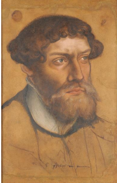
Lucas Cranach der Jüngere (1515-1586), Philipp I., Herzog von Pommern-Wolgast, um 1541.

Reims, Musée des Beaux-Arts