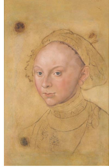
Lucas Cranach der Jüngere (1515-1586), Prinzessin Katharina von Braunschweig-Grubenhagen, um 1540/41.

Reims, Musée des Beaux-Arts