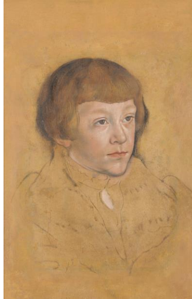
Lucas Cranach der Jüngere (1515-1586), Sächsischer Fürst (Johann-Wilhelm von Sachsen), um 1541.

Reims, Musée des Beaux-Arts