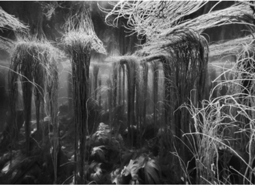
© Nicolas Floc'h, Paysages productifs, Initium Maris, île de Molène, - 4 mètres , 2019 | ADAGP, Paris, 2026