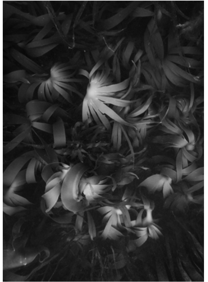
© Nicolas Floc'h, Initium Maris, Porz Gwen, Porspaul, -4 mètres , 2021 | ADAGP, Paris, 2026