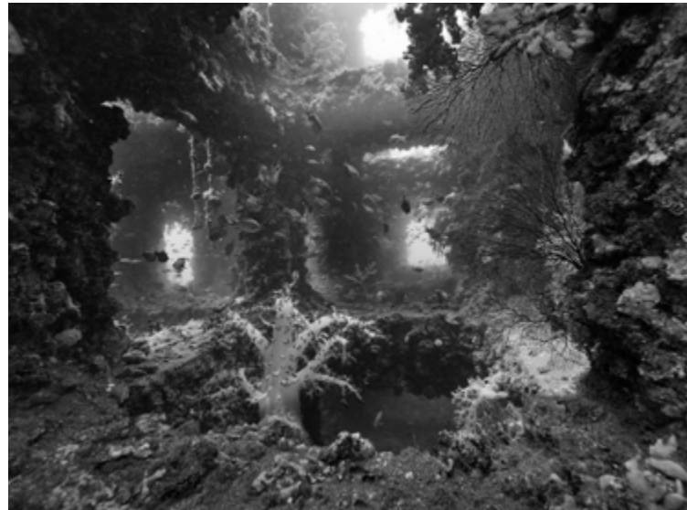
© Nicolas Floc'h, Structure productive, Tateyama, - 23 mètres , Japon, 2013 | ADAGP, Paris, 2026