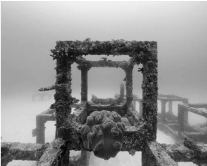
© Nicolas Floc'h, Structure productive, Kikaijima, - 8 mètres , Japon, Tara Pacific, 2017 | ADAGP, Paris, 2026