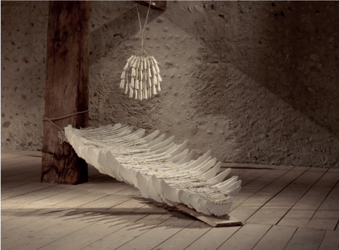
Bénédicte Vallet Phanons («Phanons») , 2019 Faserporzellan, Hanf, Holz