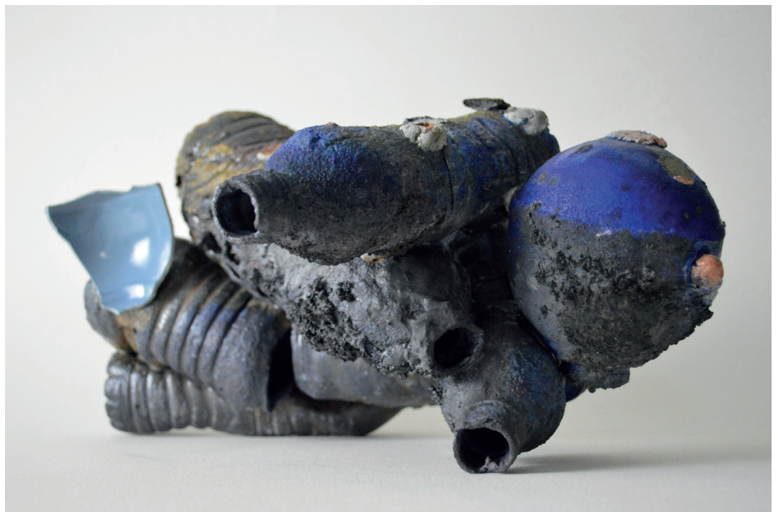
Clément Petibon Agrégat , (« Agregat »), 2022 Sandstein und Engoben