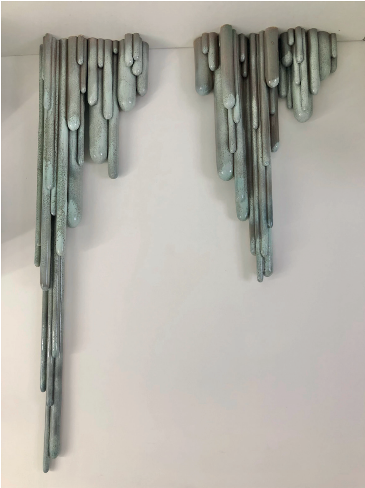
Safia Hijos Stalaktos (« Stalaktos »), 2024 Glasierte Keramik