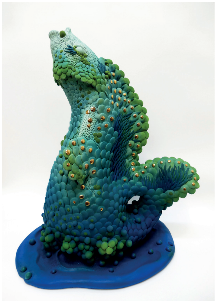
Muriel Persil Le poisson scintillant, («Der glitzernde Fisch ») , 2022 Steinzeug, Engobe, Satinemaille, Gold