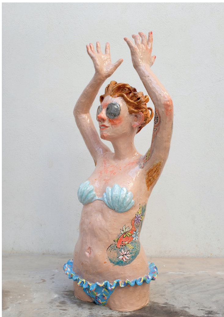
Agathe Brahami-Ferron La baigneuse , 2016 (« Die Badende , 2016») Glasierte und glänzende Keramik